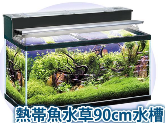
フルメンテナンス付き熱帯魚水槽リース価格表(月額)