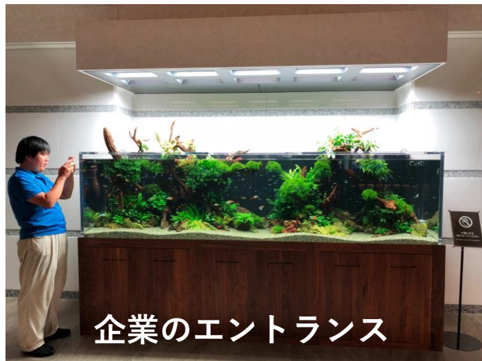
企業のエントランス